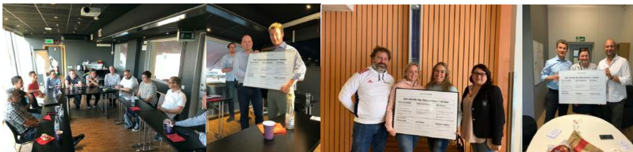
Styrelsen besöker föreningar för att diskutera värderingar.