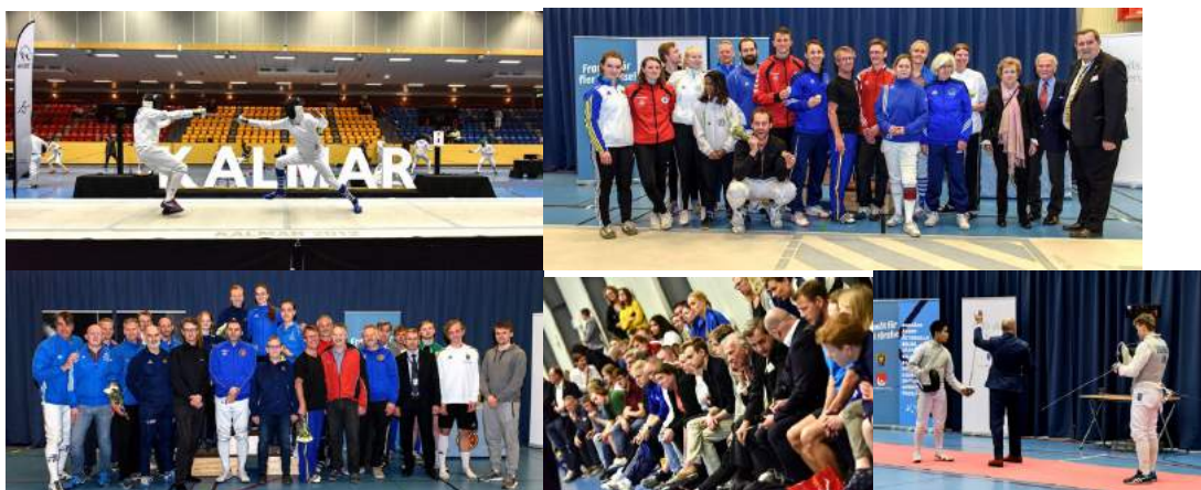
Bilder från junior-SM i Kalmar, senior-SM och lag-SM i Stockholm 2019.