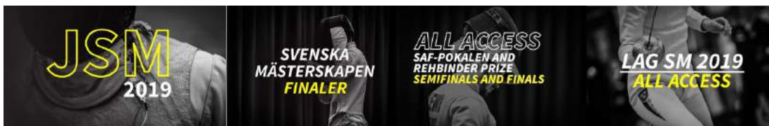
Några av Fäktkanalens websändningar från Svenska Fäktförbundets tävlingar under 2019. Bilddesign: Jonathan Bladin