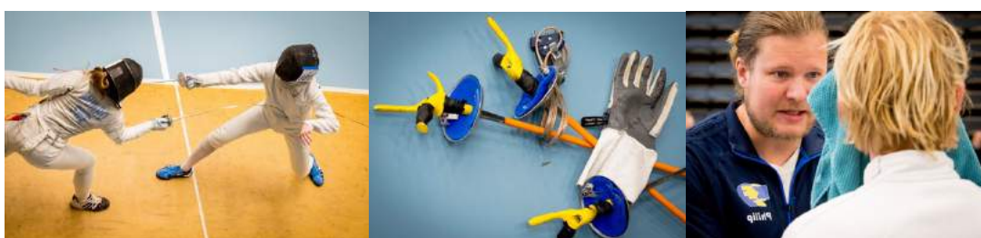
Bilder från USM i Karlskrona 2019.