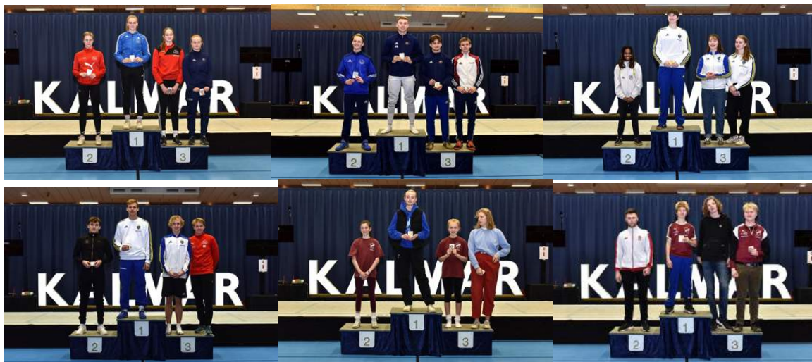
Medaljörer junior-SM i Kalmar. Fr vänster damvärja, herrvärja, damflorett, herrflorett, damsabel, herrsabel.