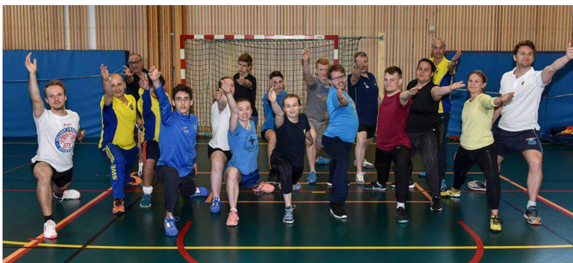
Deltagarna i tränarkurs steg 1 2019.